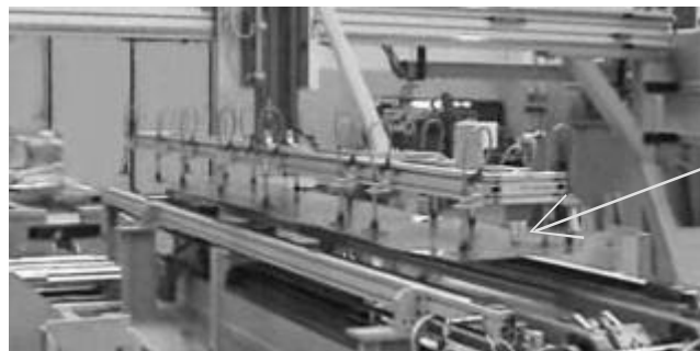
Abb.1 Blechabstapler mit einseitigem, blechberührendem Doppelblech- Sensor

Doppelblech- Sensoren überwachen die Blechvereinzlung an automatischen Blech- Abstaplern, -Robotern, -Feedern, -Transfer- Einrichtungen u.ä.